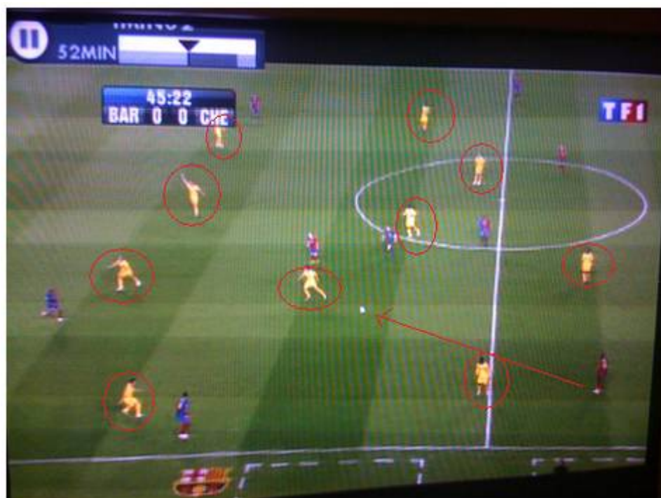
Photo 1 ce ne sont pas moins de 10 joueurs de Chelsea qui se trouvent derrière la ligne du ballon donné quelques dixièmes de secondes plus tôt par Abidal.

Les photos ci-dessous , prises lors des ½ finales de champion's league montrent bien cet état de fait .